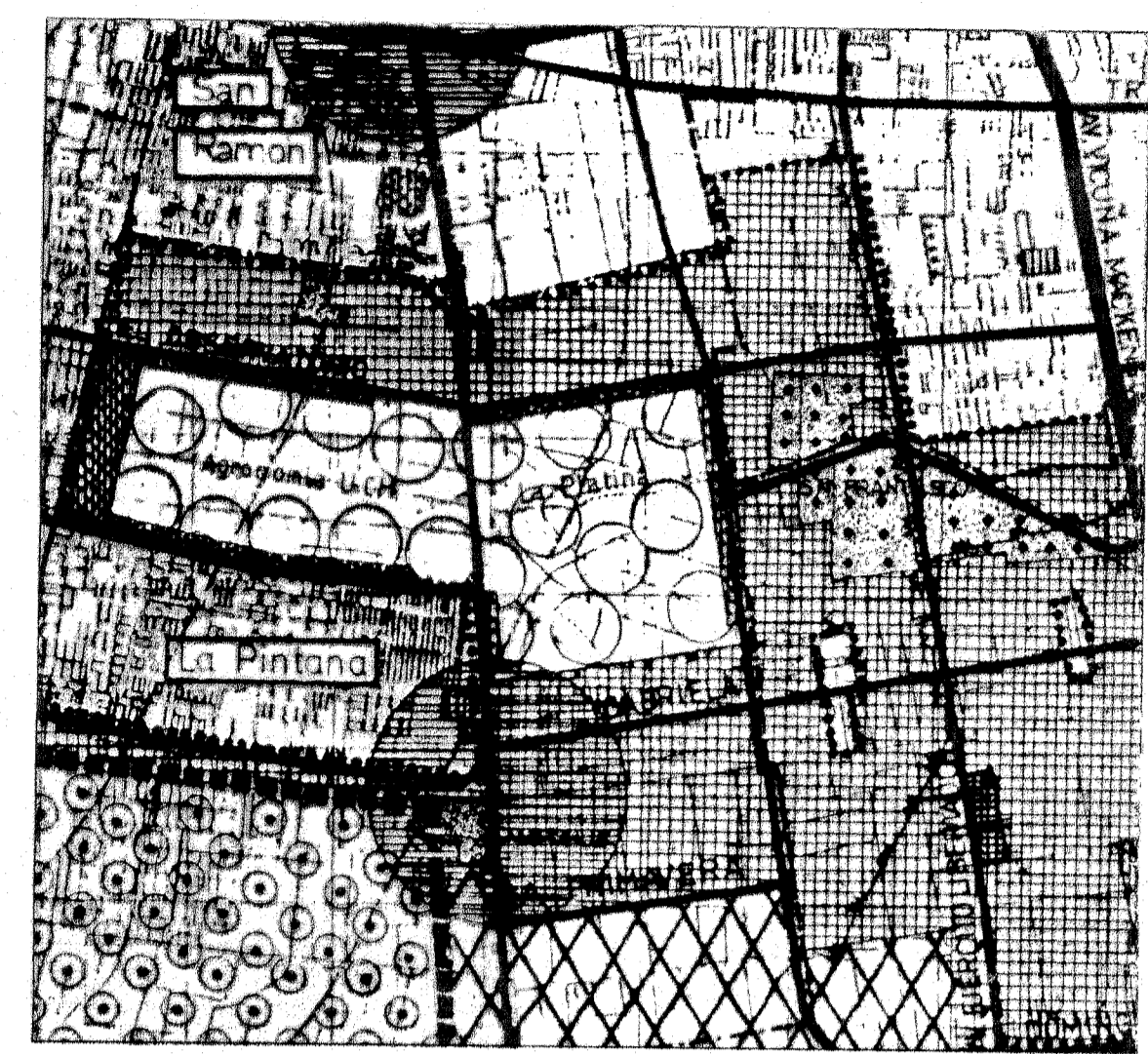
ZONIFICACION USOS DE SUELO ESCALA 1/50000 (según plano RM-PRM-92/1A)