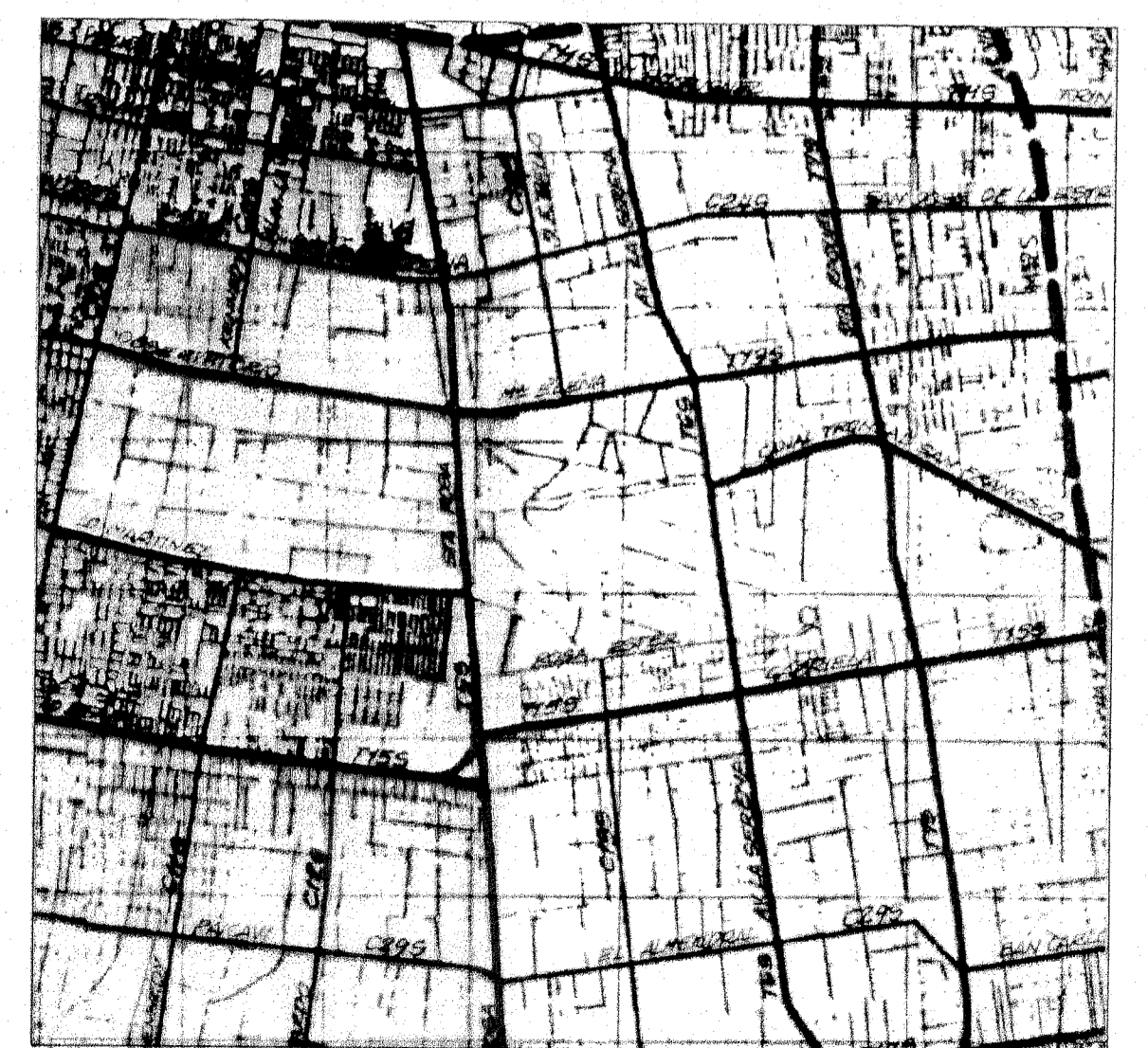
VIALIDAD ESCALA 1/50000 (según plano RM-PRM-92/1A1)