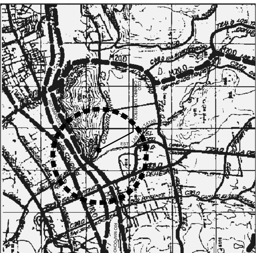
SITUACION QUE SE APRUEBA